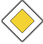
شارع رئيسي / ذو أفضلية

يجب إعطاء المركبات الأخرى الأفضلية لكم عند وجود هذه اللوحات