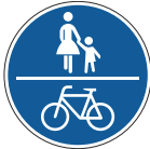
طريق المشاة والدراجات الهوائية المشترك

يسمح لسائقي الدراجات الهوائية بالسير على بعض أرصفة المشاة وأحيانا في مناطق المشاة. لكن يجب أن تكون هناك إشارة إلى ذلك، ويكون الإنتباه المتبادل في هذه الحالة ذو أهمية كبرى.